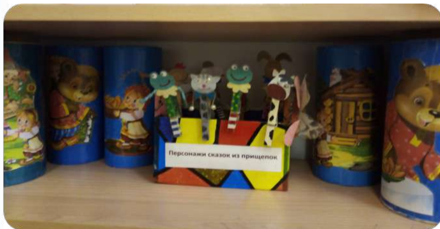
Театр на дисках